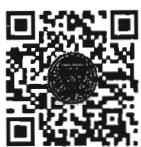
หนังสือนัดประชุม และระเบียบวาระการประชุม สภาผู้แทนราษฎร

เอกสารประกอบการประชุมสภาผู้แทนราษฎร ได้เผยแพร่ทางสื่ออิเล็กทรอนิกส์ ตามข้อบังคับฯ ข้อ ๒๑ วรรคหนึ่ง เรียบร้อยแล้ว โดยท่านสมาชิกฯ สามารถอ่านเอกสารประกอบการประชุมได้ โดยการสแกน QR Code หรือทาง www.parliament.go.th