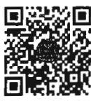
กระทู้ถามสด ด้วยวาจา